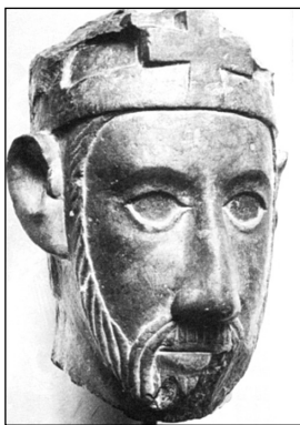
István király XII. századi ábrázolása

Mutassa be az országegyesítés folyamatát, a vármegye- és egyházszervezést! Válaszában értékelje az istváni politika sikerességének okait!