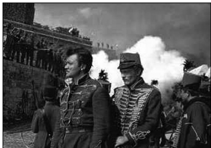
Részlet a filmből

A bécsi utcákon Richárd is ott van mint katona. A forradalmárok és Richárd csapata a Brigitta-szüzek zárdája előtt próbálják lecsillapítani a kedélyeket, de nem sikerül. Richárd a zárdában megpillantja Editet, ezután már nem távozásra akarja megkérni a nővéreket, hanem a csőcseléket elkergetni.